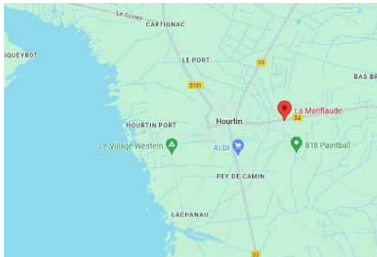
Plan situation géographique du camping

Réseau de transport public par autocar assuré par TRANSGIRONDE ( www.transports.nouvelle-aquitaine.fr )