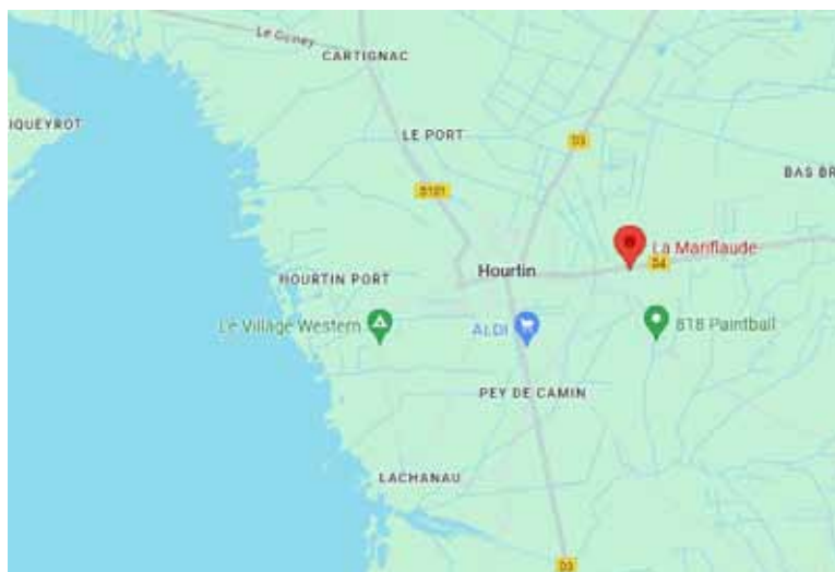
Plan situation géographique du camping

Réseau de transport public par autocar assuré par TRANSGIRONDE ( www.transports.nouvelle-aquitaine.fr )